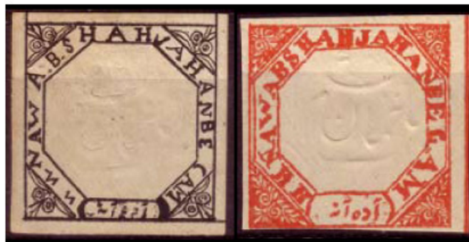
Obr. 9 13. vydání – 1896

(Faint, mostly illegible text, likely bleed-through from the reverse side of the page.)