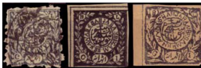
Obr. 11 Vyd. 1890

Tento menší obraz byl použit jen pro hodnotu 8 a. Existují celkem 3 vydání, která se liší jak orámováním okolo známek, tak i kvalitou tisku a písmen.