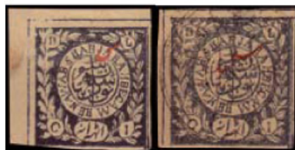
Obr. 14 Krátké „S“