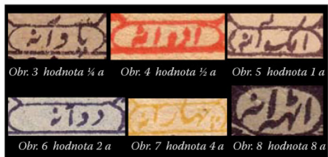
Obr. 3 hodnota ¼ a

(Faint, mostly illegible text, likely bleed-through from the reverse side of the page.)